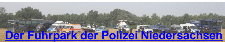
Der Fuhrpark der Polizei Niedersachsen